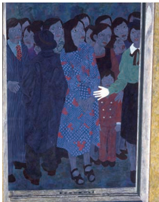
米谷清和「エレベーター」(1972年)日展初入選作、多摩美術大学大学院修了制作

だから誰かの真似とかではなく、自分の見た物のなかからモチーフを決めていったというのはありますね。(次号に続く)