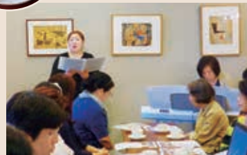
ソプラノとピアノによるミニコンサート (美術館学芸員トークサロン)