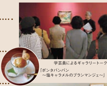
学芸員によるギャラリートーク