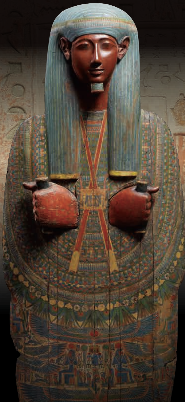
表紙: 《マミーボード(ミイラに被せられた木製の蓋)》エジプト第3 中間期(1080-664 BC) (ガンドゥール美術財団蔵)