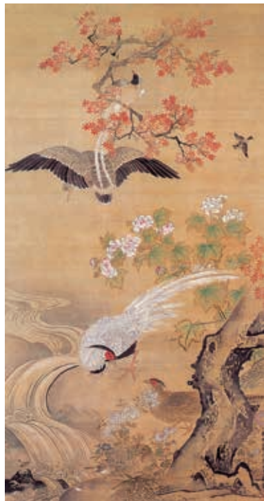
狩野探幽「四季花鳥図(秋) 永平寺蔵

本展覧会は、永平寺に所蔵される文化財のなかから、道元禅師ゆかりの品をはじめとする、絵画・彫刻・書跡・文書など、国宝・重要文化財を含む秘蔵の品々を一挙公開し、永平寺の歴史と信仰、その美を紹介します。