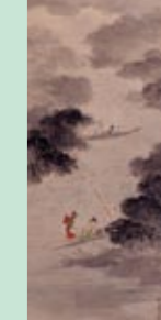
鋤形尊斎「菟道蛸図」