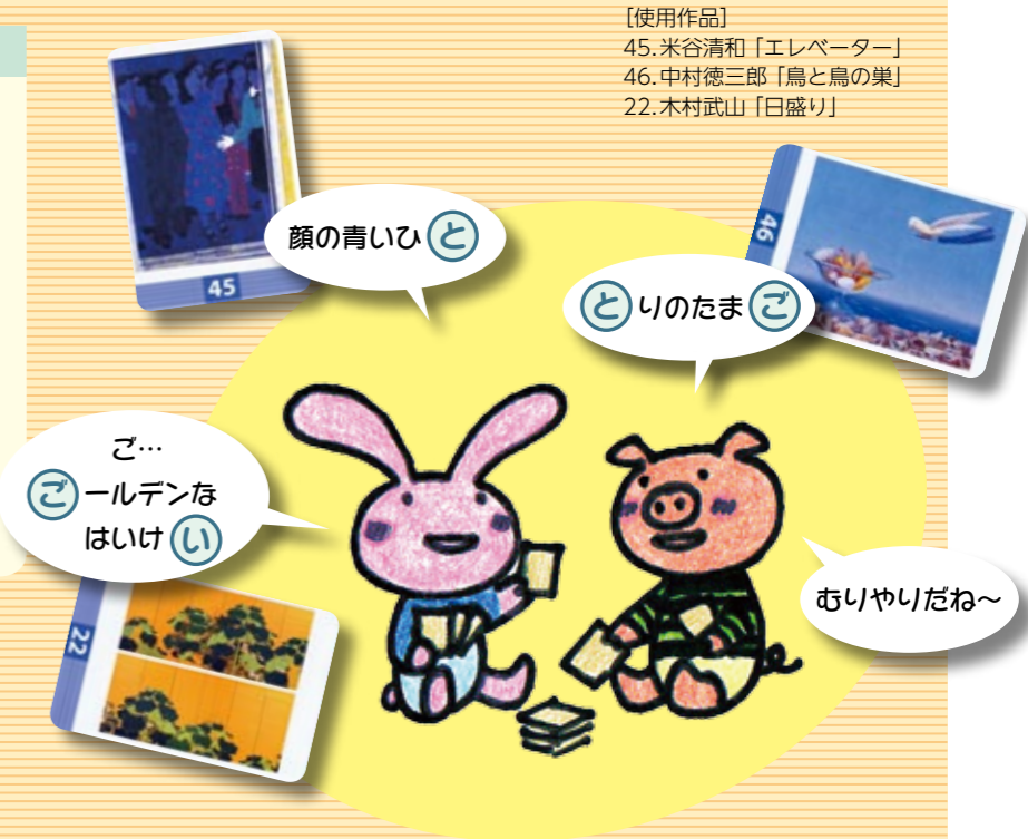
【使用作品】 45. 米谷清和「エレベーター」 46. 中村徳三郎「鳥と鳥の巣」 22. 木村武山「日盛り」