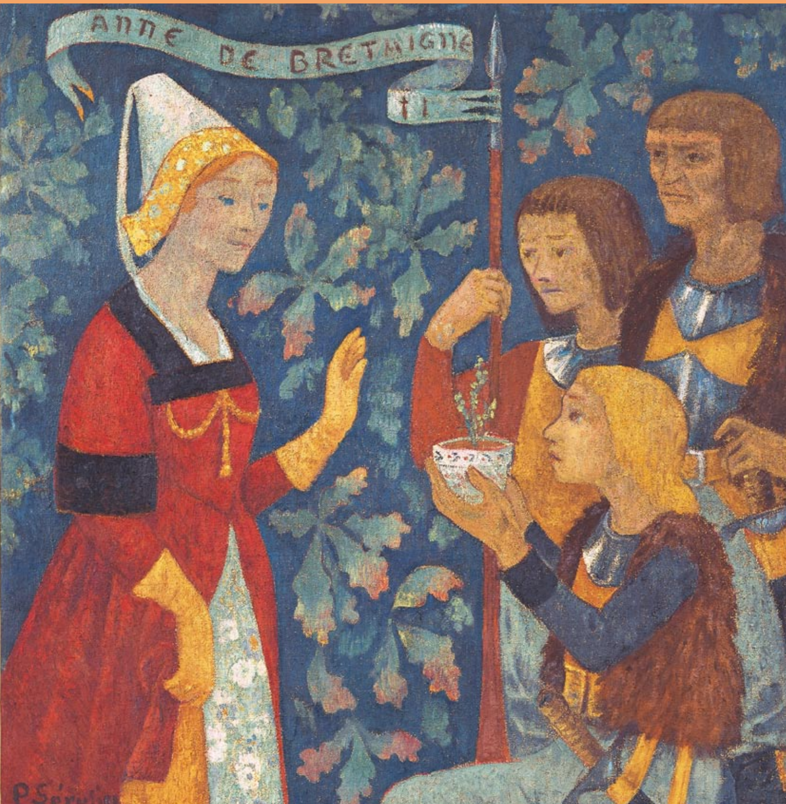
表紙：ポール・セリュジエ《ブルターニュのアンヌ女公への礼讃》 1922年 ヤマザキマザック美術館（「森と芸術」展より）