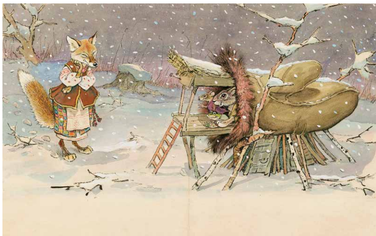
『てぶくろ』(エフゲーニー・ラチュフ・絵 内田莉莎子・訳 福音館書店 1950年)より ちひろ美術館蔵