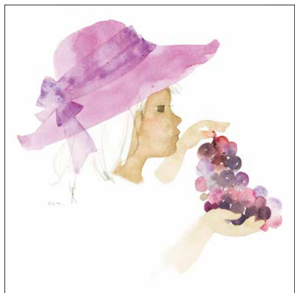
ぶどうを持つ少女(いわさきちひろ・絵 1973年) ちひろ美術館蔵