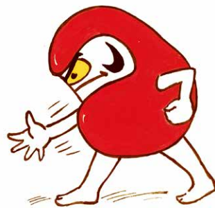
『だるまちゃん と てんぐちゃん』(かことし・作/絵 福音館書店 1967年)より © Kako Research Institute Ltd. 1967