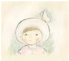
『わたしのぼうし』(佐野洋子・作/絵 ポプラ社 1976年)より オフィス・ジロチョー蔵 ©JIROCHO, Inc.