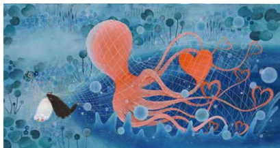
『きみへのおくりもの』(刀根里衣・作/絵 NHK出版 2015年)より 作家蔵