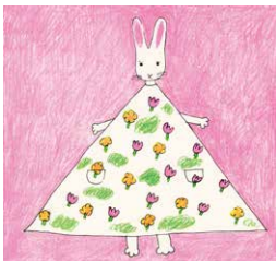
『わたしのワンピース』(西巻茅子・作/絵 こくま社 1969年/2002年)より ちひろ美術館蔵