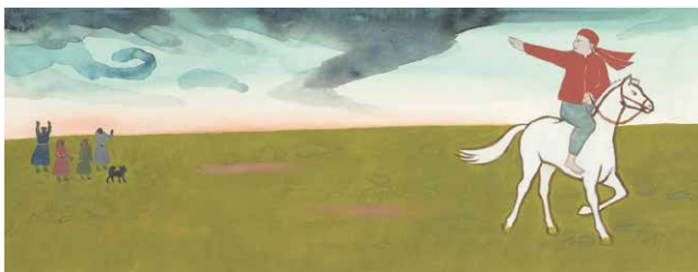
『スーホの白い馬』(赤羽末吉・絵 大塚勇三・再話 福音館書店 1967年)より ちひろ美術館蔵