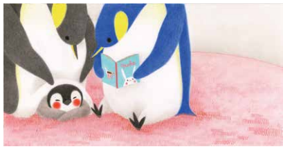
『ぼくのぼしよのに』(刀根里衣・作/絵 NHK出版 2018年)より 作家蔵